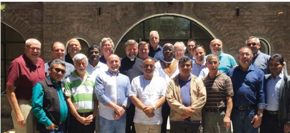
Reunión de los Superiores Mayores en Chile donde se aprobó la propuesta de una Provincia Latinoamericana.

Este apoyo se realiza en muchas formas, dijo P. Kirch: espiritual, emocional y financiero. “Vamos a mantener un relación continua con América Latina. Los Misioneros allí son nuestros hermanos; siempre serán parte de nosotros, y también nosotros mismos nos seguiremos enriqueciendo debido a nuestra relación con ellos, como hemos experimentado desde el comienzo,” dijo P. Kirch. “Esto no es el término de algo; es el comienzo de una nueva relación.”