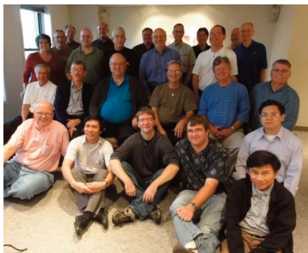
Miembros, candidatos y asociados laicos C.P.P.S., en la reunión de octubre 2011, en Chicago.

Los asistentes a la reunión expresaron su agradecimiento a las dos casas C.P.P.S. en Chicago, por su hospitalidad.