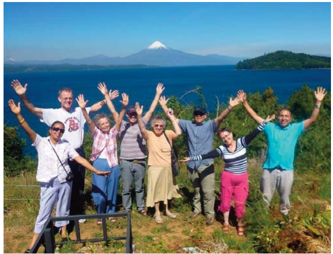
Miembros de la familia del la Preciosa Sangre disfrutando la vista, cerca de Purranque, Chile.