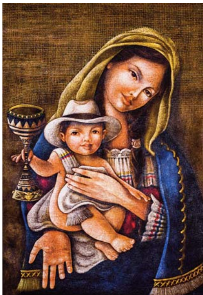
Nuestra Señora de la Preciosa Sangre y su divino hijo están vestidos en atuendo Colombiano

Los Misioneros han pedido al pueblo Colombiano rezar a Nuestra Señora de la Preciosa Sangre, mujer de reconciliación, para pedirle su intercesión en el trabajo por lo gran una paz duradera. Pedimos a todos en la familia de la Preciosa Sangre unirse a ellos en esta plegaria.