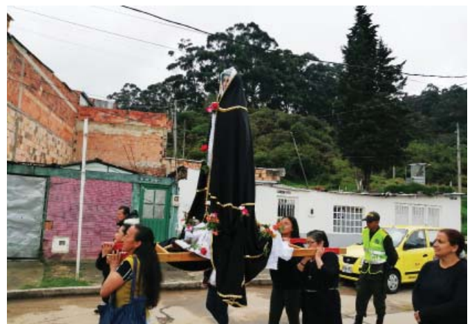
Procesión en la parroquia N.S de los Alpes.