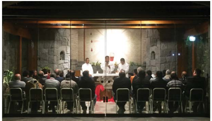
Los miembros se reúnen en oración en la capilla de la casa de ejercicios en Chaclacayo.

“El proceso (de llegar a ser una provincia nueva) es largo pero necesario para que cada miembro vaya