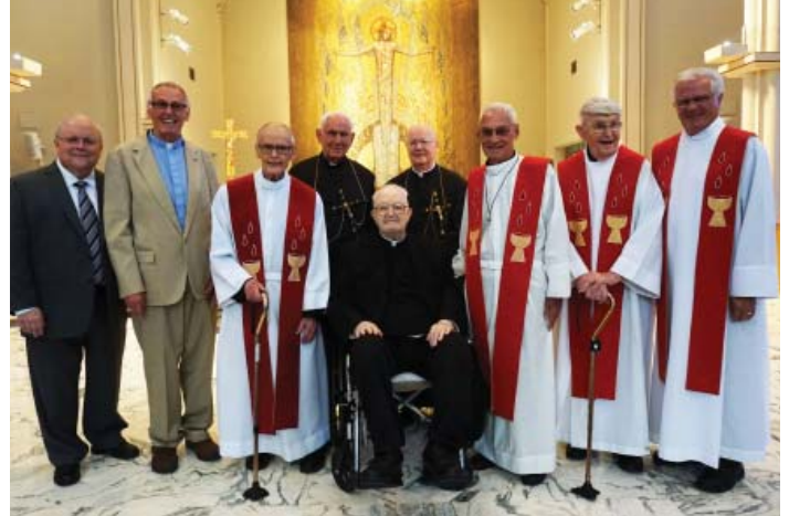
Algunos de los festejados en el Centro de St. Charles.

“Es esa Sangre que el sacrificó por todos—la que declaró tan poderosamente que somos hermanos y hermanas, unidos en la Sangre de Cristo. Es lo que